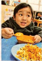
製作環保酵素方法簡單,整個過程由剪膠皮成粒,到量糖、注水,都是幼兒可做到的步驟,更可訓練他們度量衡的概念。