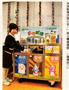
發覺回收箱是「沙田」幼兒,長者及社會服務處下幼兒教育中心於2015年,與環保局合作設計的一系列環保教材。當小朋友沒得入回收箱,隨便丟棄:「膠樽要拍扁,撕去紙貼,沖洗乾淨才放入。」放入回收箱後說:「做得好!」