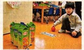
高身紙包飲品盒,可以是好玩的「保齡球機」。